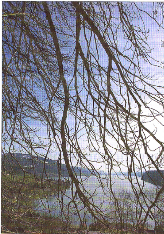
Sur les hauteurs du village du Pont, vue sur le lac de Joux en enfilade. VALLÉE DE JOUX, 22 AVRIL 2005