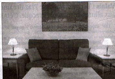
Une chambre à l'Hôtel des Horlogers. Décoration à la fois simple et chic. LE BRASSUS, 22 AVRIL 2005

Vallée de Joux Tourisme, tél. 021 845 17 77 ou www.myvalleedejoux.ch