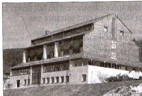
L'Hôtel des Horlogers, au Brassus, a ouvert il y a quelques semaines. LE BRASSUS, 22 AVRIL 2005

Au premier, l'une des petites suites est ouverte: un grand lit, deux salles de bains, un salon avec canapé-lit. Par la fenêtre, on voit le pâturage monter jusqu'à la forêt